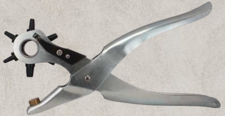
art 6209 PINZA FUSTELLATRICE A RUOTA