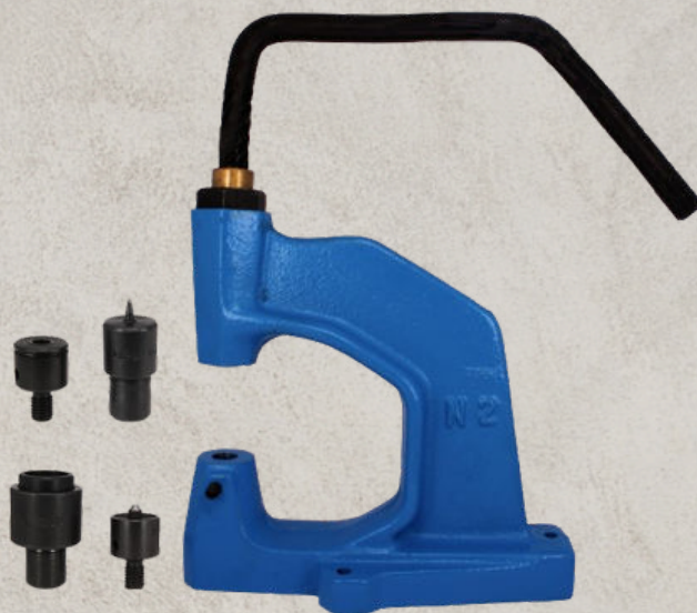
art 6237 TORCHIETTO E PUNZONI PER BOTTONI A PRESSIONE, BOTTONI JEANS, RIVETTI, OCCHIELLI, ECC.