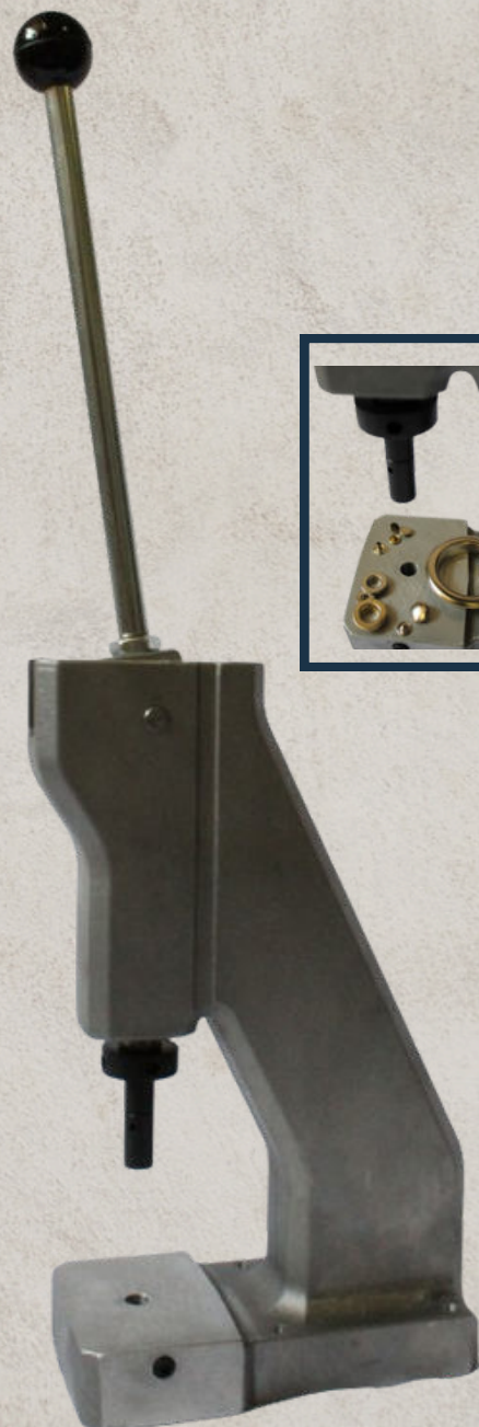
art 6243 TORCHIO A LEVA