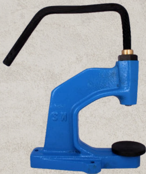
art 6202 TORCHIETTO PER BOTTONI DA RICOPRIRE