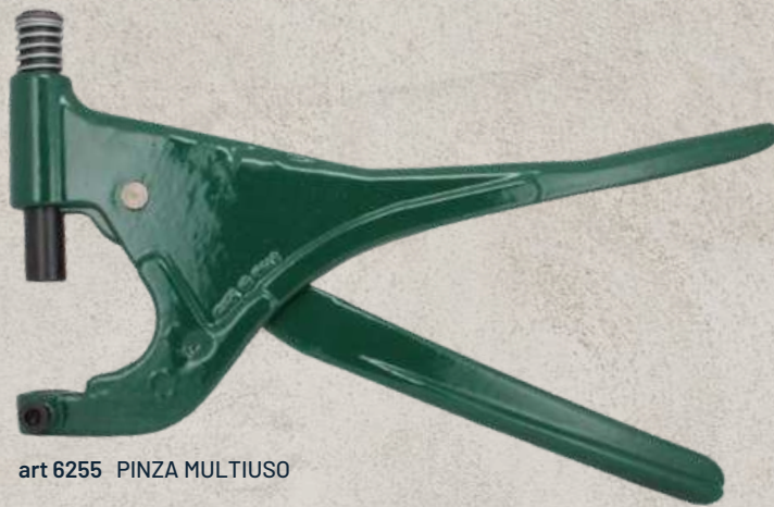
art 6255 PINZA MULTIUSO