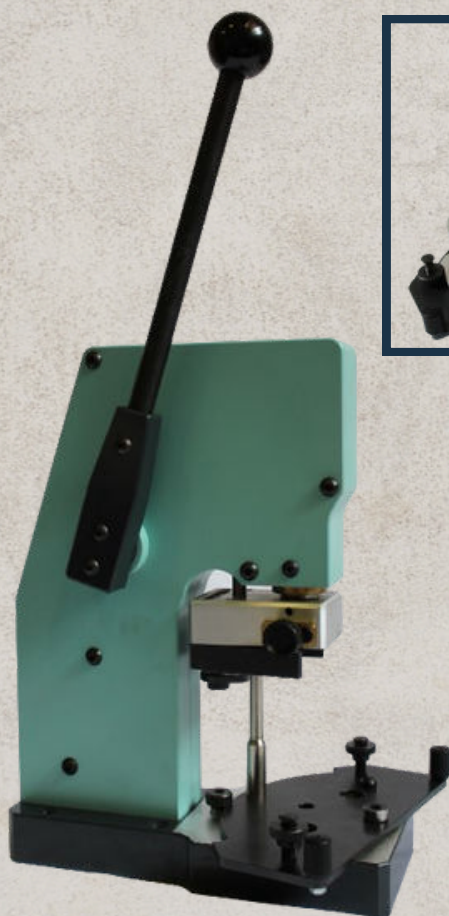
art 6252 TORCHIO A GIOSTRA PER BOTTONI DA RICOPRIRE