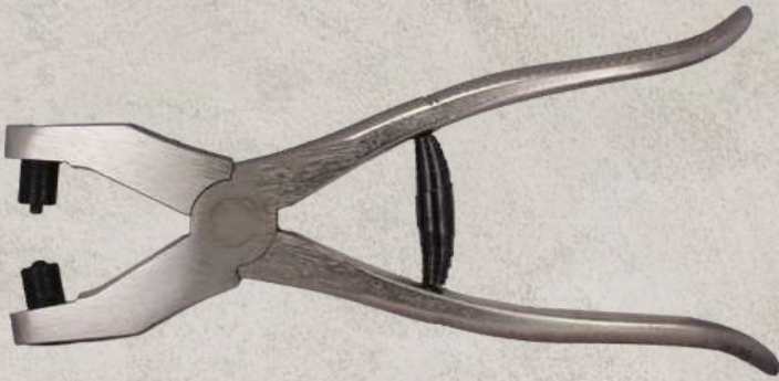
art 6206 PINZA CON PUNZONE PER APPLICAZIONE OCCHIELLI